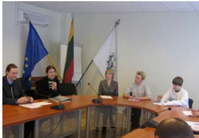
Informacinis susitikimas Anykščių savivaldybėje, 2006 03 08

Projektas „Jaunimas už skaidrumą“ prasidėjo labai panašiai. Tik, kadangi, jis buvo tarptautinis, tai idėja rutuliojosi keliais lygmenimis.