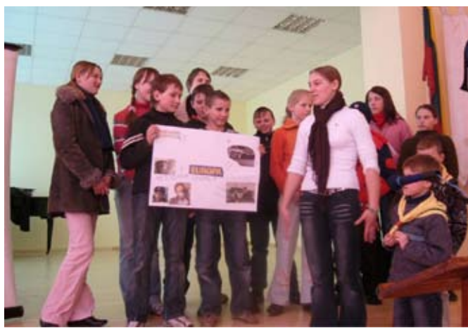
Projekto pristatymas Mažeikių r. Vieksnių seniūnijoje