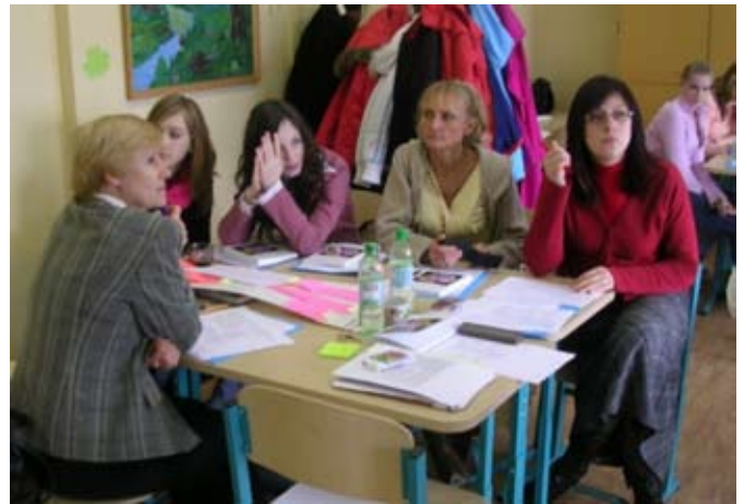
Seminaras „Strateginis planavimas“ Mažeikių „Ventos“ vidurinėje mokykloje, 2006 04 11

Tarptautinio projekto koordinatoriai nusprendė padėti savivaldybių komandoms apsispręsti dėl projektinių veiklų, organizuodami strateginio planavimo seminarus. Juose dalyvavo mokytojai, mokiniai ir savivaldybės tarnautojai. Seminarų metu buvo taikoma „aktyvaus susirinkimo“ metodika.