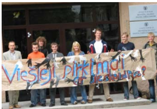
Projektą apie viešuosius pirkimus pristato Anykščių A.Baranausko vidurinės mokyklos moksleiviai.