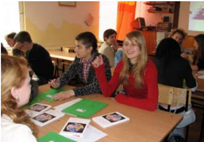
Seminaras „Strateginis planavimas“ Anykščių A.Baranausko vidurinėje mokykloje, 2006 04 27