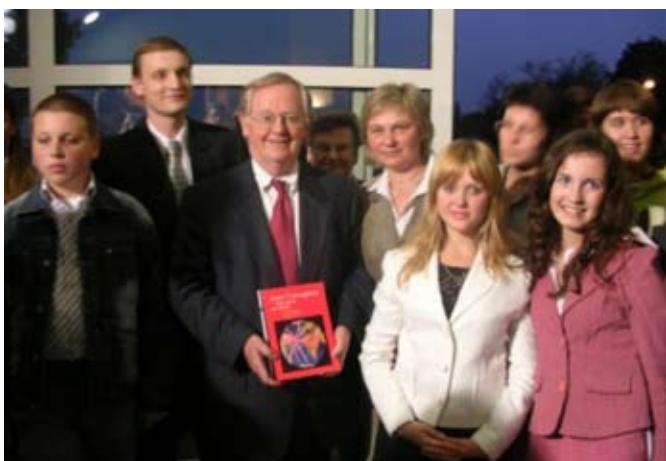
Projekto dalyvių priėmimas JAV ambasadoje Lenkijoje. Centre - ambasadorius Victor Ashe