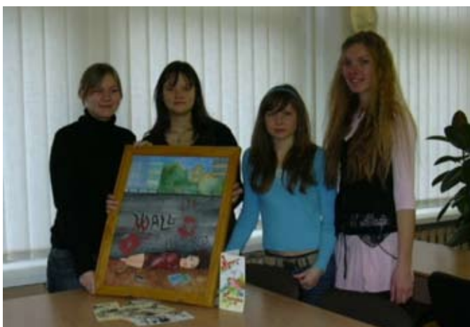
Elektrėnų sav. Vievio gimnazijos moksleivės pristato projektą apie Migracijos tarnybos veiklą