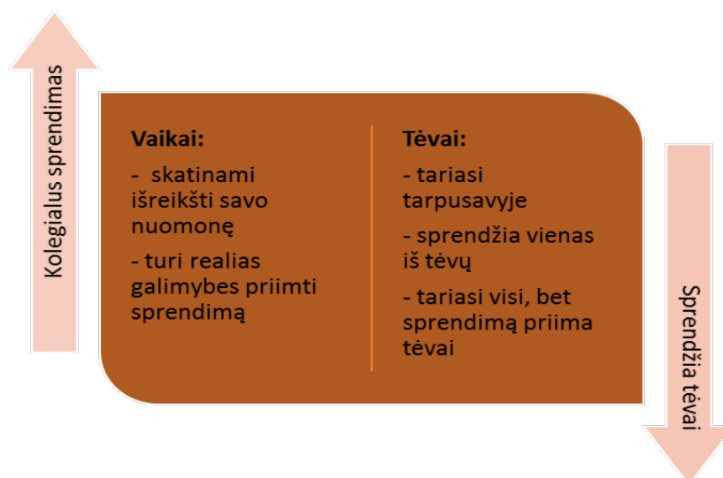
4 pav. Kritinio mąstymo ugdymo prielaidos: svarbių sprendimų priėmimas

Apklauskos metu paaiškėjo, kad visgi, šeimai svarbius sprendimus dažniausiai priima vienas iš tėvų arba tėvai pasitarę tarpusavyje. Trečdalis tyrimo dalyvių nurodė, kad visada arba dažnai organizuoja visos šeimos pasitarimą, bet sprendimą priima tėvai. Taigi, galima teigti, kad lemiamą balsą priimant sprendimus šeimose turi tėvai.