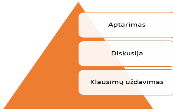
2 pav. Kritinio mąstymo ugdymo prielaidos: bendravimo būdai su vaiku

Vienas iš būdų ugdyti šiuos gebėjimus - inicijuoti diskusijas šeimoje. Nustatyta, kad taikant šį būdą, dažniausiai diskutuojama apie vaiko ir šeimos aktualijas, retai (nepriklausomai nuo vaikų amžiaus) – apie šalies aktualijas.