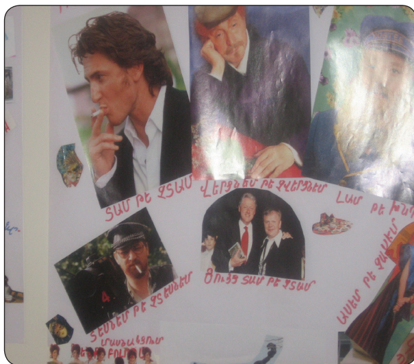
Nekaj primerov tehnik za kreativno razmišljanje:

Pred ali med uporabo tehnik za kreativno razmišljanje lahko vrstniški svetovalec svetovancu pomaga definirati možne rešitve njegovih težav. Svetovanca lahko vpraša, katere rešitve so se mu že utrile in katere je že preizkusil. V nekaterih primerih lahko informacije, ki jih ponudi svetovalec, nakažejo nove rešitve.