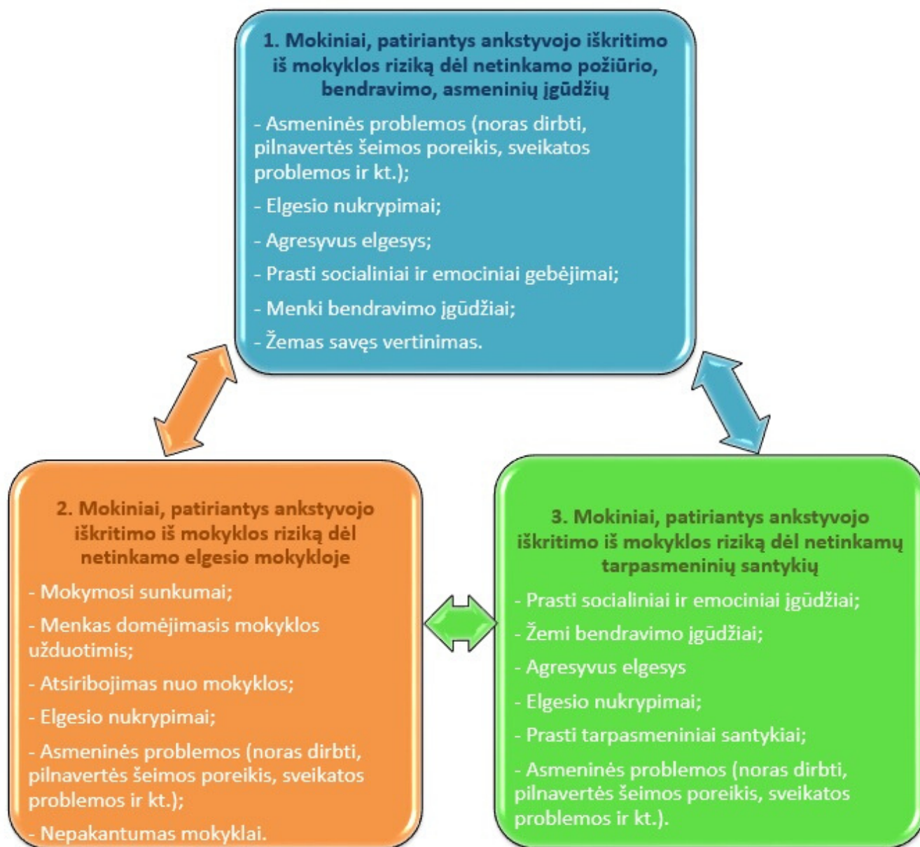
1 pav. Tipologinis modelis „Mokiniai, patiriantys ankstyvojo iškritimo iš mokyklos riziką“

Grupių požymiai buvo apibrėžti remiantis požiūrio / elgesio aprašais. Pastarieji taps antrojo A.C.C.E.S.S intelektualinio produkto – Ankstyvojo iškritimo iš mokyklos monitoringo ir prevencijos sistema (IO2) – pagrindu.