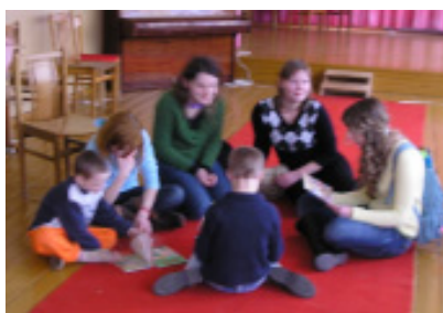
Vaikų globos namuose