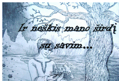
Mokinių kūrybos almanachas