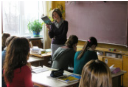
„Pradėkime dieną su knyga“

Molėtų gimnazijoje vyko akcija „Dieną pradėkime su knyga“ – pirmoji pamoka prasidėjo mokytojai skaitant knygos ištrauką. Mokiniai susitiko ir diskutavo su tėvais ir seneliais, turinčiais asmenines bibliotekas namuose, vyko diskusija „Kompiuteris ar knyga“. Mokiniai rengė ir pristatė mokyklos bendruomenei savo kūrybos almanachą, surengė knygų reklaminių lankstinukų parodą. Vyko knygų mainų mugė „Dovanoju Jums knygą“.