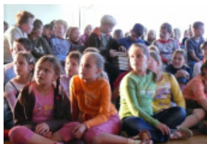
Mažųjų skaitytojų būrys