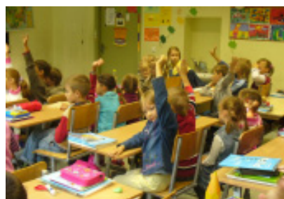
Mokiniai aktyviai dalyvauja diskusijoje