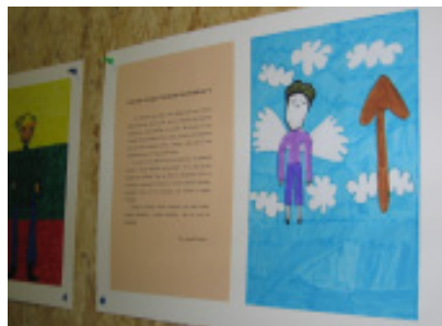
Knygų iliustracijų paroda