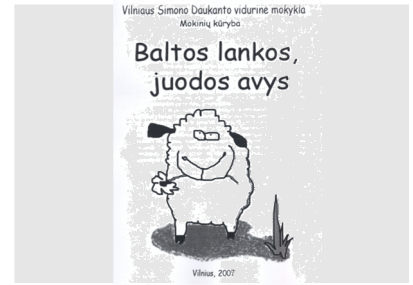
Mokinių kūrybos almanachas