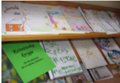
Mokinių kūrybos ir knygų iliustracijų paroda