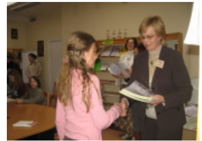
Mokyklos direktorė apdovanoja aktyviausius skaitytojus

Šilutės 1-osios gimnazijos bibliotekoje buvo surengta paroda, skirta tarptautinės literatūros dienai paminėti. Visą dieną, per visų dalykų pamokas vyko aktyvūs skaitymai, pristatymai bei aptarimai, diskusijos apie skaitymo svarbą ir kitos veiklos.