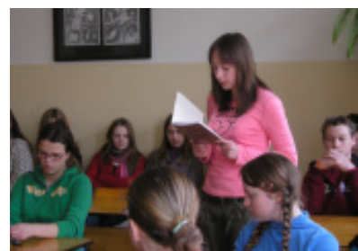
Mokiniai skaito savo kūrybą