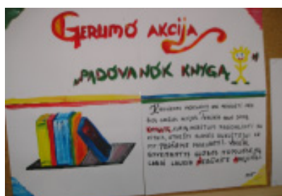
Gerumo akcijos skelbimas