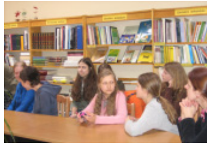
Diskusija „Knyga man ne dain“