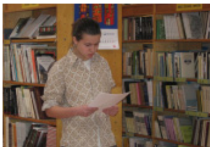
Mokiniai pristato savo kūrybą