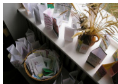
Knygų reklamos lankstinukai