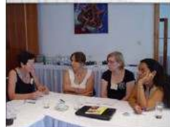
Seminaras Bratislavoje – reflektuojame savo mokymąsi