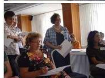
Seminaras Bratislavoje – Inovatyvių strategijų demonstravimas