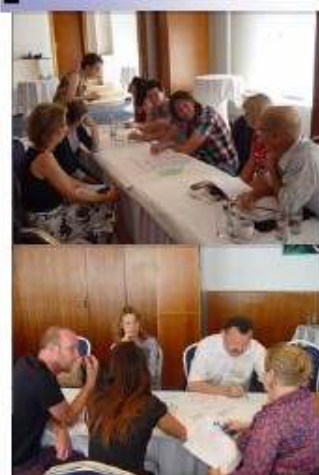
Seminaras Bratislavoje – Grundtvig kurso planavimas