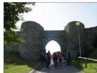
Seminaras Bratislavoje – tarpkultūrinio mokymosi motyvacijos skatinimas. Sesijos gamtoje